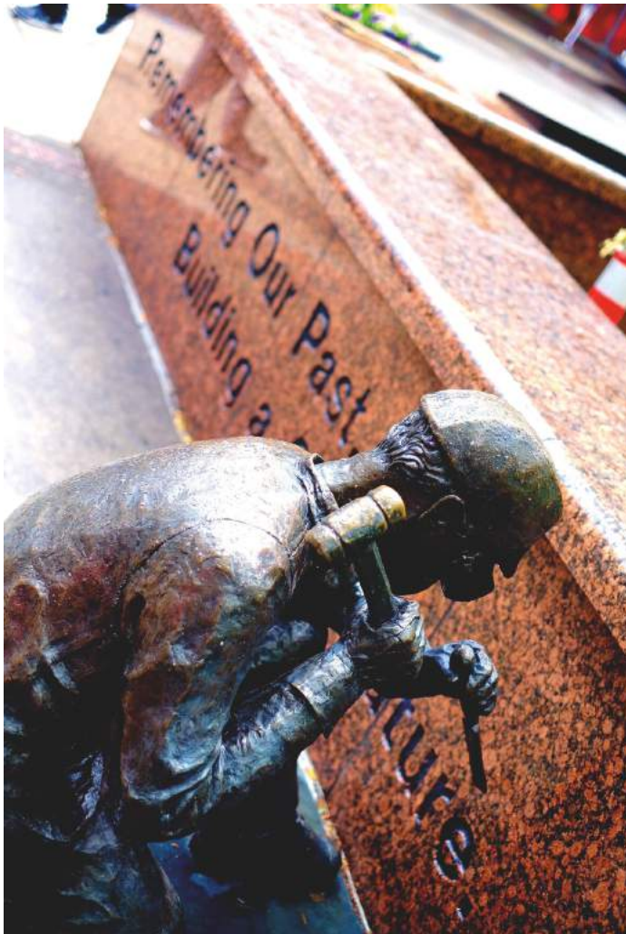
100 Workers

Gegensatz zu früheren EU-Handelsabkommen enthält CETA keine Klausel, die besagt, dass die Achtung der Menschenrechte ein wesentlicher Bestandteil des Abkommens sei 3 . Ferner führt das CETA-Kapitel zu Handel und Arbeit keine verbindlichen und durchsetzbaren Arbeitsnormen ein, die gewährleisten könnten, dass die ILO-Kernarbeitsnormen respektiert und umgesetzt werden. Das CETA-Kapitel zu Handel und Arbeit (Kapitel 23) ermuntert die Vertragsparteien lediglich dazu, sich um hohe Arbeitsstandards zu bemühen . Bezeichnend für die Prioritäten der CETA-UnterhändlerInnen ist, dass die Kapitel