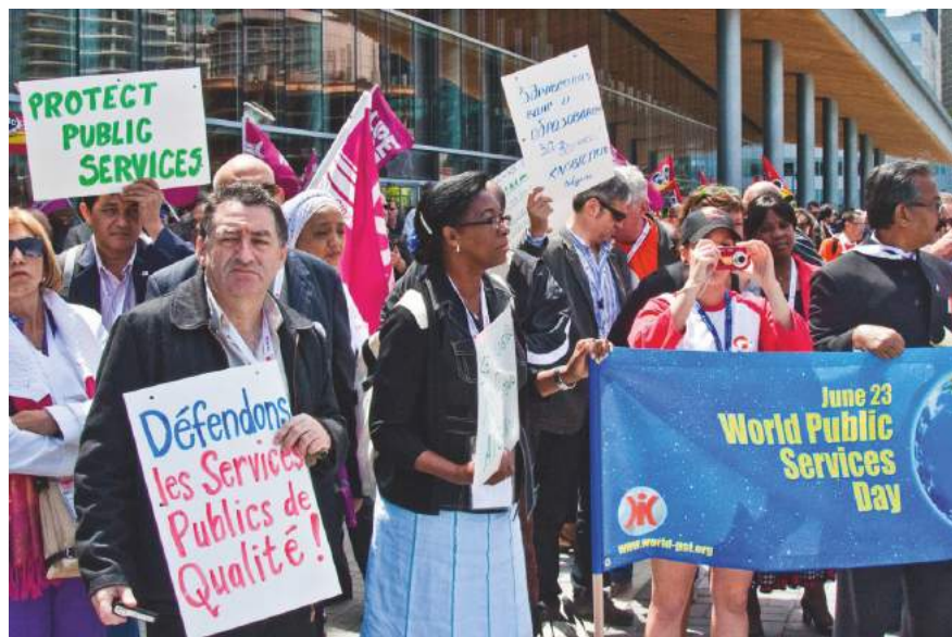
International Trade Union Confederation July 2010

Durch die Festlegung der Regeln für Handel und Investitionen zwischen den