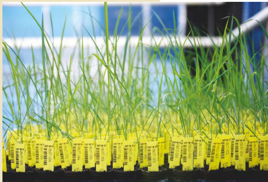
Crop Design – The fine art of gene discovery!

Neben dem eigentlichen Artikel über Biotechnologie ist das Kapitel über Investitionsschutz von besonderer Bedeutung. Kanadische Biotech-Konzerne könnten es nutzen, um bei einer Verschärfung oder Anpassung der Regulierung von Gentechnik in der EU auf Schadensersatz zu klagen. Auch in dieser Hinsicht stellt CETA eine Gefahr für die Regulierung von genmanipulierten Organismen dar.