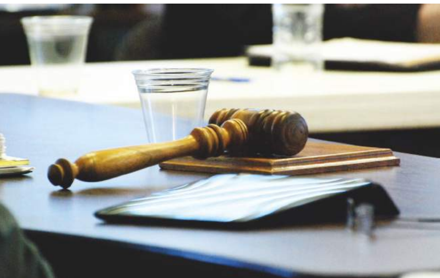
Airport Advisory Determines Future Plans After Election Results