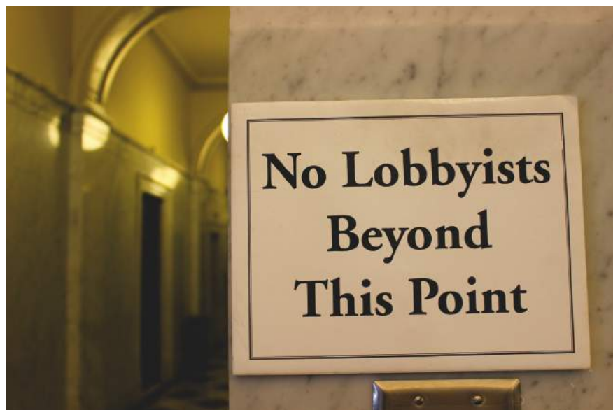
Maryland State House

Die in CETA vorgesehenen Regeln zu regulatorischer Kooperation 2 schaffen Institutionen und Prozesse zur Zusammenführung von Regulierungen in Kanada und der EU. Existierende und künftige Gesetze sollen darüber angepasst werden, Standards könnten dadurch unter erheblichen Druck