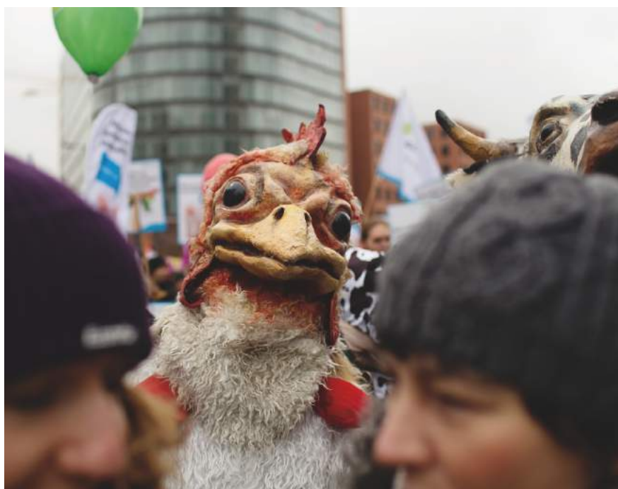
»Wir haben es satt!« 2016

Der Preisunterschied für Schweinefleisch in Kanada und der EU ist gravierend. In Kanada lag das Preisniveau einige Jahre bis