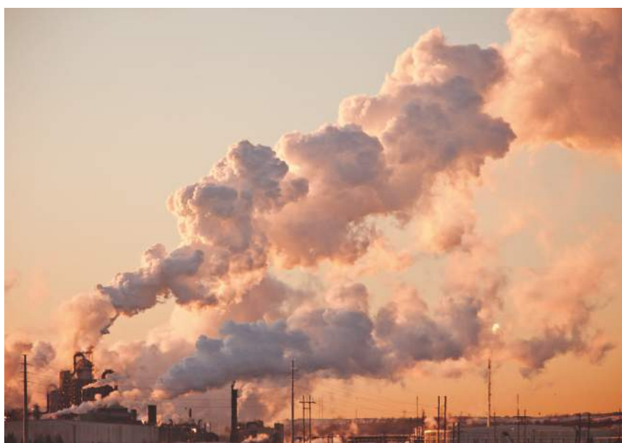
Fort McMurray, Alberta – Operation Arctic Shadow

Die Weltgemeinschaft hat sich – zuletzt in dem Pariser Klimaabkommen vom Dezember 2015 – auf das Ziel verständigt, den Anstieg der durchschnittlichen Erdtemperatur „deutlich unter 2 °C über dem vorindustriellen Niveau“ zu halten und sogar Anstrengungen zu unternehmen, den