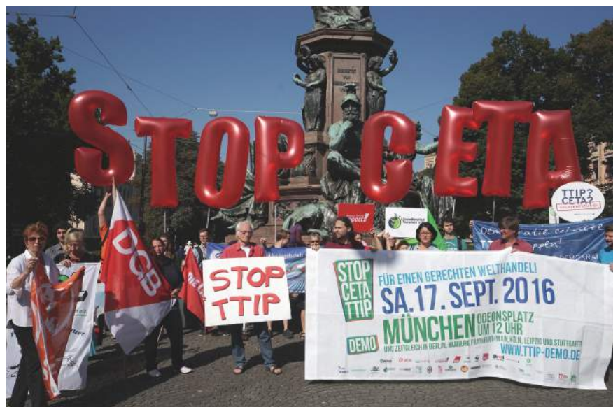
TTIP Demo 16. 09. 16

Im Herbst 2016 wird der EU-Rat entscheiden, ob er die Unterzeichnung des