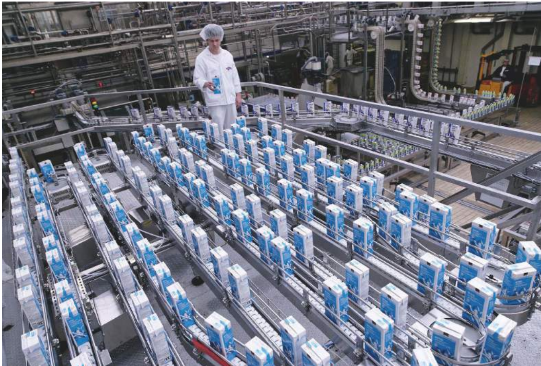
EMMI MITTELLAND MILCH AG SUHR

Produktions- und Schlachtwege umzustellen, um hormonfreies Fleisch für den Export zu erzeugen. Durch diese verstärkten Importe aus Kanada würde der europäische Fleischsektor unter erheblichen Preisdruck geraten.