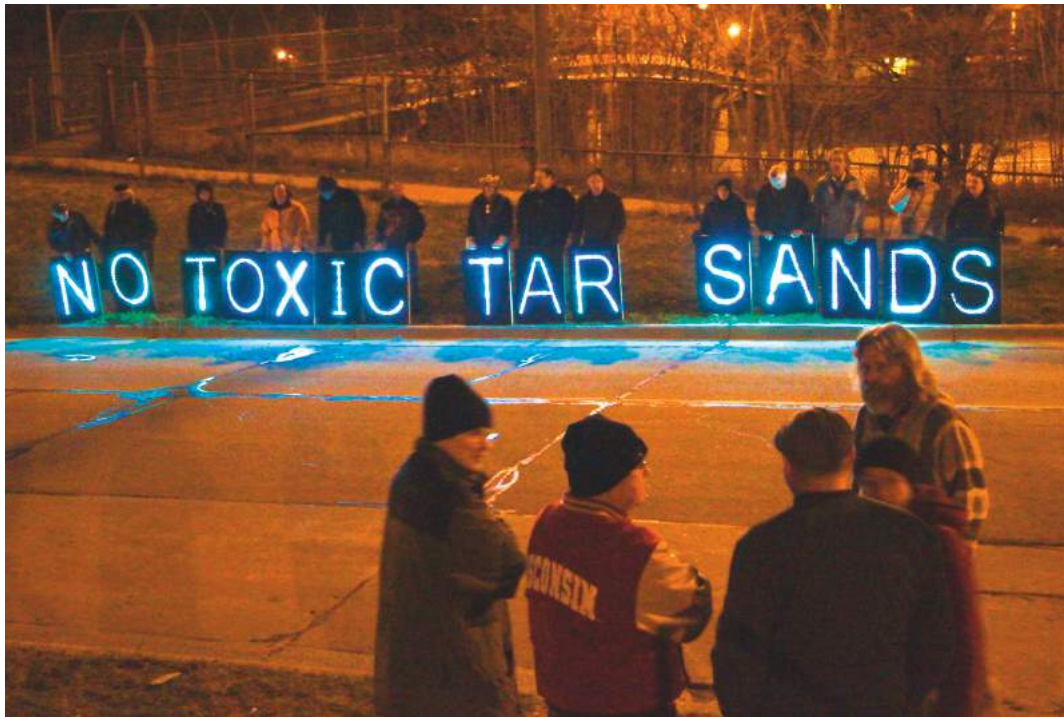
Wisconsin Stands Against Tar Sands

von Unternehmen in Europa und Kanada in diesen Sektoren tätig ist und mit CETA eine neue Anspruchsgrundlage erhält.