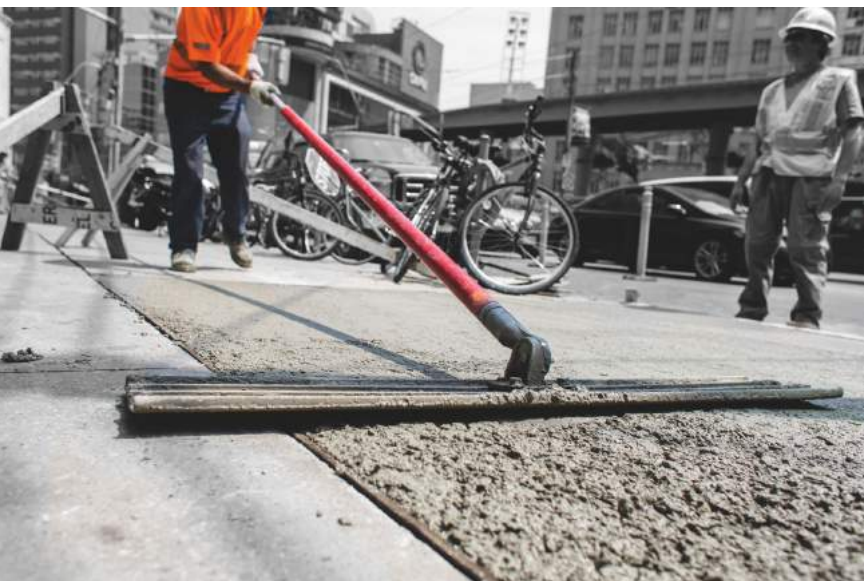
Jet Set Dry

den Schutz der Wanderarbeiter (Nr. 97 und Nr. 143) zu ratifizieren und umzusetzen. CETA wird kaum dazu beitragen, die Ratifizierung der vielen Konventionen voranzubringen, die die EU-Mitgliedstaaten und Kanada noch nicht ratifiziert haben. So haben zwölf EU-Mitgliedstaaten sowie Kanada die wichtige Konvention über Arbeitsschutz und Arbeitsumwelt noch nicht ratifiziert 4 .