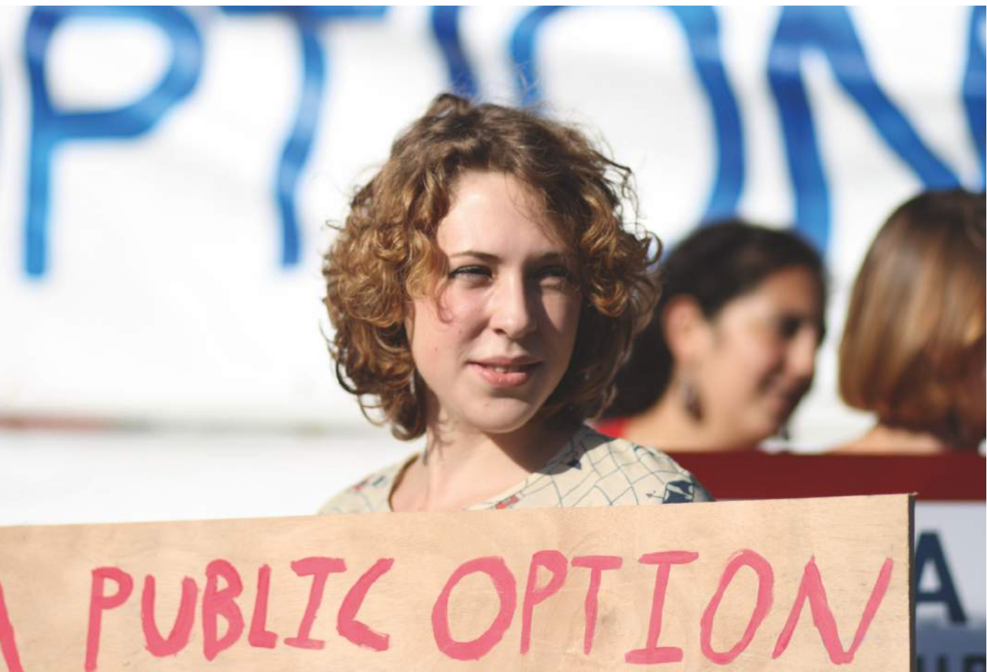
Health care reform supporter 2 at town hall meeting in West Hartford, Connecticut

allen Handelsabkommen der EU – in CETA in vollem Umfang geschützt seien. Begründet wird dies damit, dass Investoren und Dienstleister einer Vertragspartei alle maßgeblichen Vorschriften, die auf dem Gebiet der anderen Vertragspartei gelten, respektieren müssen. Allerdings ist mit CETA nicht gewährleistet, dass die Vertragsparteien ihre Entscheidungsfreiheit darüber behalten, wie sie öffentliche Dienstleistungen bereitstellen und regulieren wollen. CETA reduziert den politischen Gestaltungsspielraum zugunsten des Marktzugangs sowie des Schutzes ausländischer Investoren und Dienstleister. Das Abkommen schränkt den Spielraum von Regierungen weitreichend ein, öffentliche Dienstleistungen auf lokaler, kommunaler, nationaler und regionaler Ebene gemeinwohlorientiert bereitzustellen und zu regulieren.