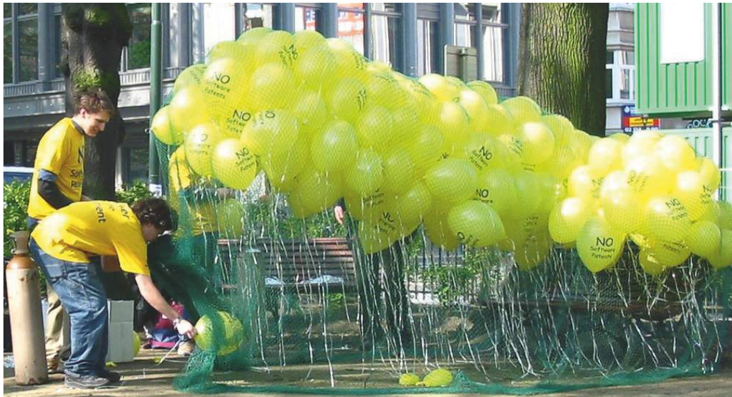
No to software patents, yes to balloons

Diese Bestimmungen sind im CETA-Kapitel zum geistigen Eigentum (Kapitel 20) enthalten. In Bezug auf digitale Rechte ist die vorgesehene Begünstigung von Non Practicing Entities (NPE) am kritischsten zu sehen. Solche auch als „Patentrolle“ bezeichneten Unternehmen nutzen Lücken des Patentsystems, um Schadensersatz von innovativen Firmen zu fordern, ohne selbst irgendwelche Produkte oder Dienstleistungen zu produzieren. CETA würde die Position dieser Firmen durch die Ausweitung des Patentschutzes stärken. Des Weiteren legten zu einem früheren Zeitpunkt geleakte Entwürfe des Abkommens die Vermutung nahe, dass CETA sich durch die verstärkte Regulierung von Urheberrechten tiefgreifend auf die Internetfreiheit auswirken würde. Die endgültige Fassung des Textes ist in diesen Bereichen jedoch erheblich verwässert.