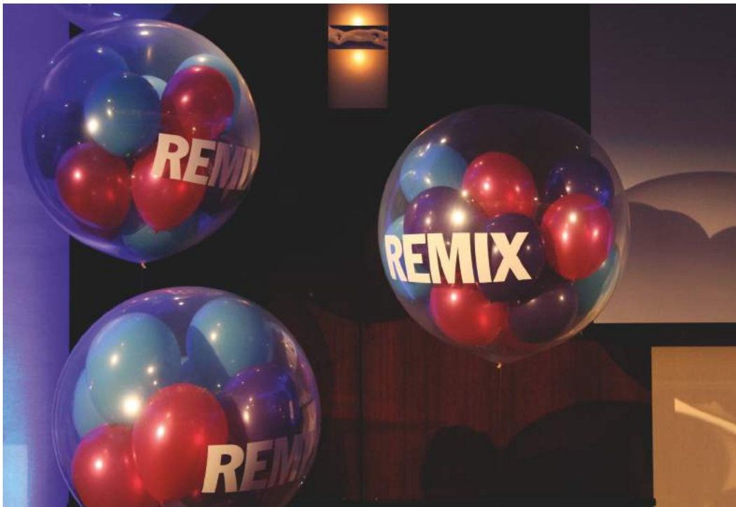
Lawrence Lessig Remix Party

CETA würde die Abdeckung von Patentfällen über ISDS/ICS weiter ausweiten, gesetzgebende Entscheidungen der EU in den Geltungsbereich von ISDS/ICS bringen und es für EU Mitgliedstaaten unmöglich machen, sich von ISDS/ICS zurückzuziehen.